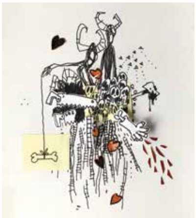
Imatge de Santi González

Convocatòria oberta fins al 5 d'octubre.