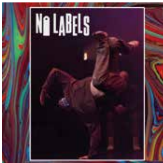
Imatge d'Iron Skulls

Es una trobada entre crews d'artistes del moviment (dansa, circ, teatre físic...) on a través de diferents fases amb pautes d'improvvisació es generaran diàlegs dansats en un espai escènic, lumínic i sonor que muta segons els impulsos de les artistes i tècniques que ho componen. L'esdeveniment és presentat per un "speaker" i com a afegit als diàlegs dansats es mostren espectacles de la companyia i/o artistes inspiradores de l'escena actual.