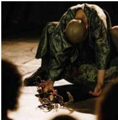
Fotografia de Xavier Mamano

El lloc central de la proposta ocupa el cos físic, que travessat per una història mitològica, es transforma en el