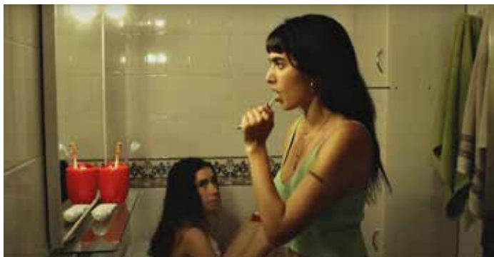
Fotograma d'Un fil roig i vermell

Una sèrie de curtsmetratges experimentals (2019-2022) que parlen sobre l'amistat, la família, les coincidències i el destí. Inspirat en “El fil roig del destí” (線紅) una llegenda xinesa que conta que existeix un fil vermell invisible que connecta a dues persones destinades a estar unides. Una experiència immersiva i enigmàtica que genera reflexió i no deixa indiferent a l'espectador.