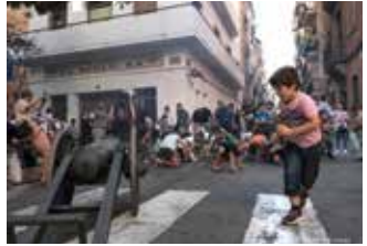
Fotografia de Vicens Forner

Exposició col·lectiva de fotografia, pintura, gravat, escultura, il·lustració i altres disciplines artístiques. La mostra també acollirà els cartells participants al Concurs de Cartells de la Festa Major de La Barceloneta 2023.